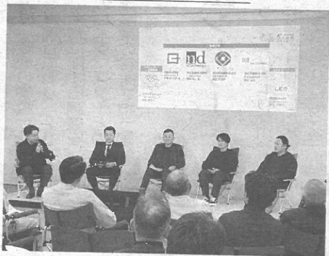
成果発表会の様子

・繊維産業DX推進コミ ュニティ(通称ひつじD X)。三星毛糸が代表で、 国島(愛知県一宮市)、中 伝毛織(同)・伴染工(同)、 宮田毛織工業(同)、長谷 虎紡績(羽島市)、渡六毛 織(同)が参加し、デジ タルやサイバーセキュリ ティーに関するノウハウ を持つ企業から支援を受 け、7月から勉強会を重 ねてきた。 成果発表会では各社が 事例を紹介。そのうち、