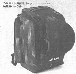
ヘルメット外付けパー ンクバックル

れや砂が落ちない」とい ったママの悩みを解消す るため、座談会などを経 て700人を超える少年 野球の保護者の声を集 めた。期間は来年1月10 日まで。 「バッグの中で荷物が ごちゃごちゃに……」汚